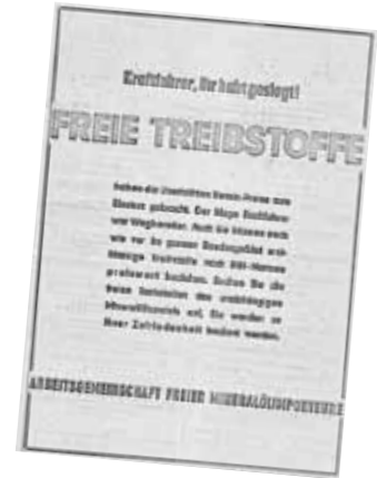
Anzeige in „Die Welt“ vom 16. 1. 1960

„Einige unabhängige Mineralölimporteure aus Nordrhein-Westfalen, Hamburg und Berlin haben sich zur Arbeitsgemeinschaft Freier Mineralölimporteure (AFM) zusammengeschlossen, die ihre vorläufige Geschäftsstelle in Hamburg, Glockengießerwall 2, eingerichtet hat. Wie uns die Arbeitsgemeinschaft mitteilt, beabsichtigt sie, die Interessen des freien Mineralölhandels sowohl im Kontakt mit den gesetzgebenden Körperschaften und den Ministerien als auch durch Aufklärung der Öffentlichkeit wahrzunehmen. Ziele der Vereinigung sind vor allem der Abbau der noch bestehenden Importrestriktionen sowie eine Senkung der fiskalischen Einfuhrbeschränkungen.“